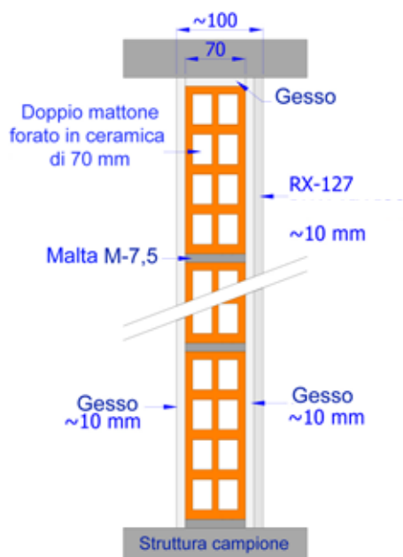
SCHEMA DELLA SEZIONE DI PROVA PER LA DETERMINAZIONE DEL MIGLIORAMENTO DI RIDUZIONE ACUSTICA CORRISPONDENTE A RX-127 RUALAIX ISOLXTREM