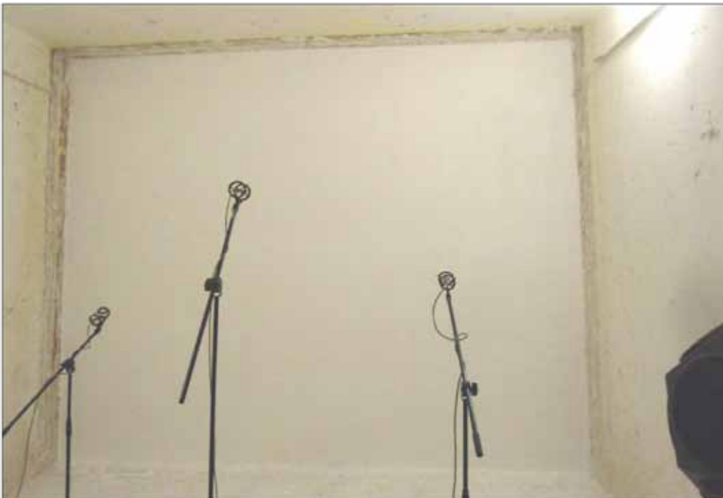
Prova di quantificazione della riduzione acustica di RX-127 RUALAIX ISOLXTREM