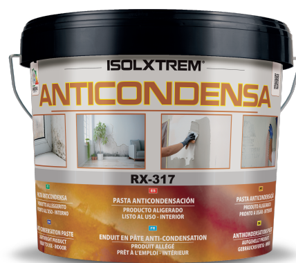
10 Kg. cod. RX-317

Utilizza la soluzione definitiva per combattere la fastidiosa muffa nei bagni e nelle cucine con ANTICONDENSA , il rivoluzionario stucco termico pronto all'uso.